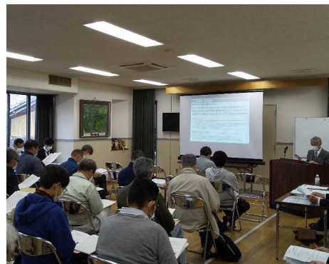
▲総会開催中の様子

日 時 2021年3月28日（日）14時00分～ 第6回まちづくり協議会終了後、続けて開催） 場 所 村野会館（枚方市村野本町12-20） 出席者数 本人出席：45名 代理人出席：1名 委任状出席：22名 合計：68名（出席率90.7%）