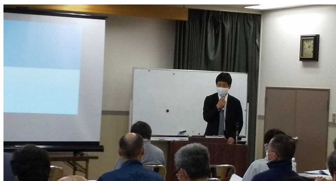
▲枚方市挨拶（枚方市住宅まちづくり課 堀井課長）