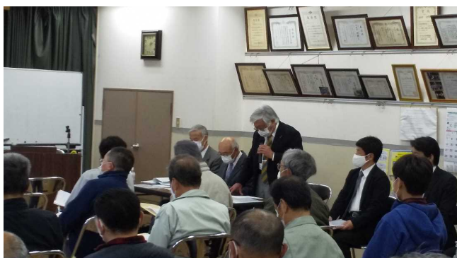
▲司会進行（まちづくり協議会 下野副会長）