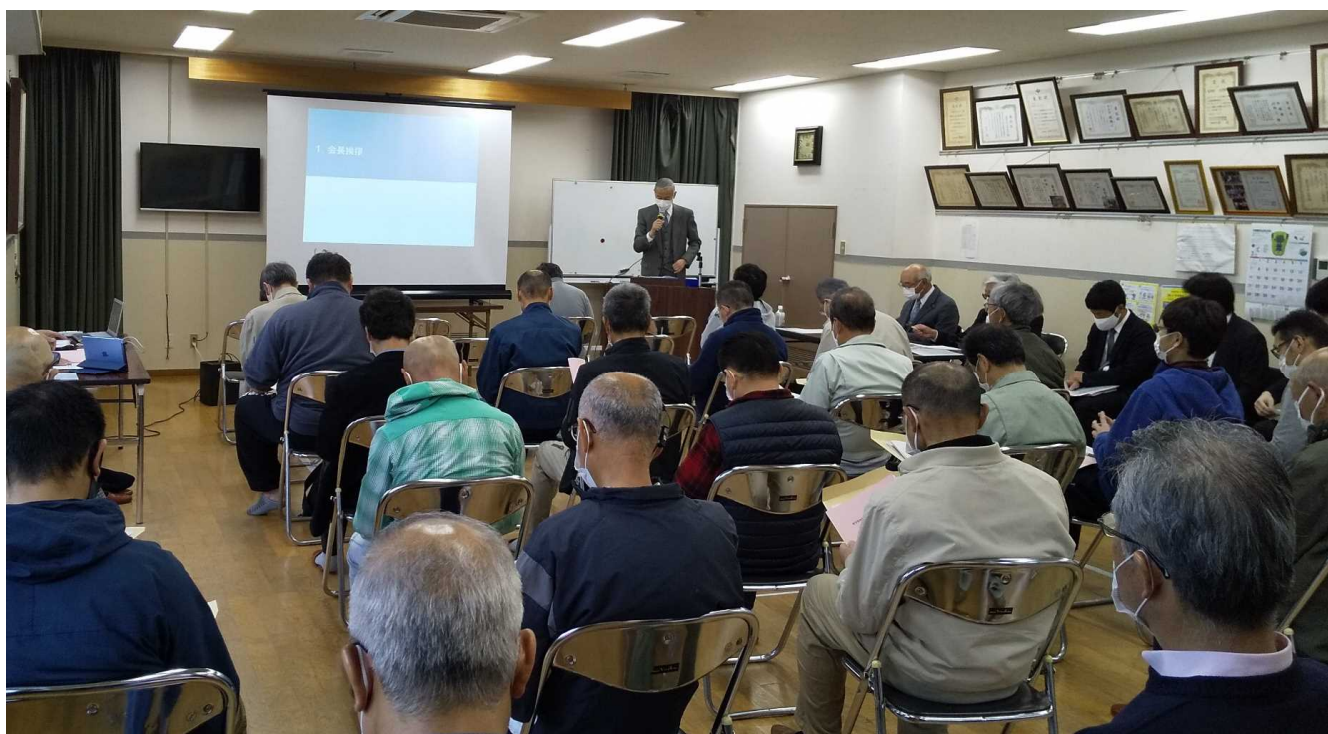
▲開会挨拶（まちづくり協議会 君家会長）

地権者の皆様の意向を汲んだまちづくりが実現できるよう、引き続きご協力をお願いいたします。